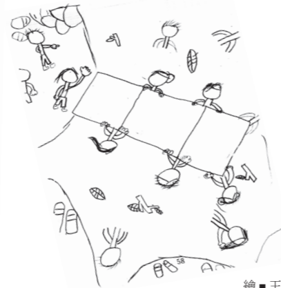
繪 ■ 王守恩

《蹦蹦車》張又軒 坐上了貨車 一路往曾文溪的上游 搖搖晃晃 好像隨時都會掉下 風往我的臉上飛過來 還有木頭枝足良樹芒 往我的肩上拍過來 突然車停了 看見了長長的溪流 老師說我們到了