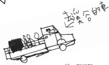
繪 ■ 張又軒

《瀑布》王守恩 我腳下有大小不依的石頭 咿嗒咿嗒 興奮的走在石頭路上 沿著彎彎曲曲的小路往前走 看到又高又大的瀑布 唰唰唰唰 驚訝的張開嘴巴 在溪流中 交到一個個活潑開朗的朋友